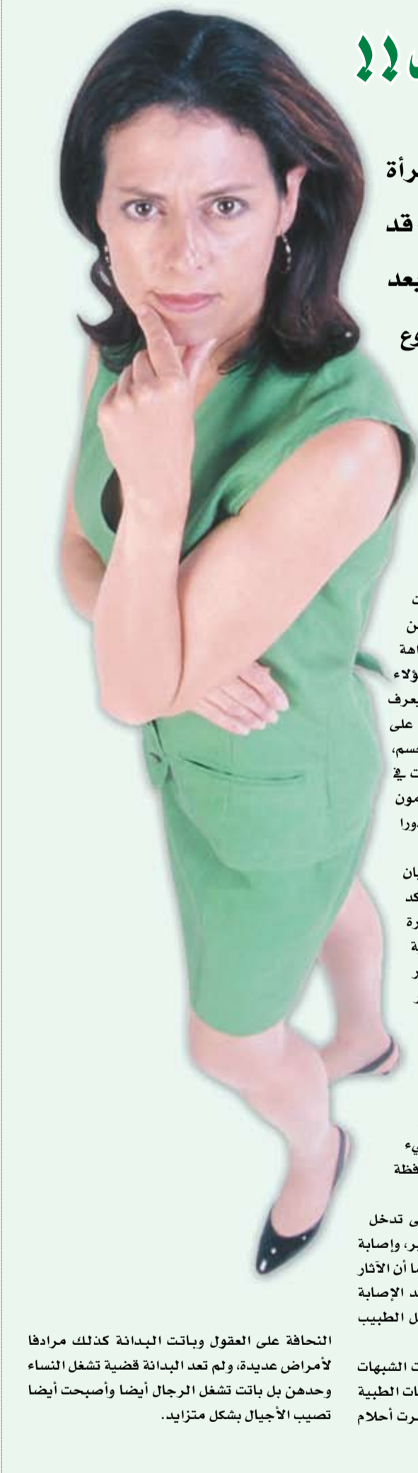
النحافة على العقول وباتت البدانة كذلك مرادفاً لأمراض عديدة، ولم تعد البدانة قضية تشغل النساء وحدهن بل باتت تشغل الرجال أيضاً وأصبحت أيضاً تصيب الأجيال بشكل متزايد.

وهو هولا في الدراسة، أظهرت الأبحاث العلمية الحديثة أن اضطرابات نظام التغذية المثله في العصبية أو الشرابة في الطعام قد تعود أيضاً إلى عوامل بيولوجية وليست نفسية فقط. فقد كشفت دراسة طبية سويدية حديثة النشأة عن أن ظهور مثل هذه الاضطرابات ناجم عن مهاجمة الجهاز المناعي للجزيئات المسؤولة والتحكم في مراكز الشهية في المخ. ويؤكد سيرجي فيتسوف أستاذ التغذية بمعهد كارولنسكا الطبي ورئيس الفريق البحثي أن هذا الاكتشاف يمهّد الطريق لإيجاد نظام علاجي فعال