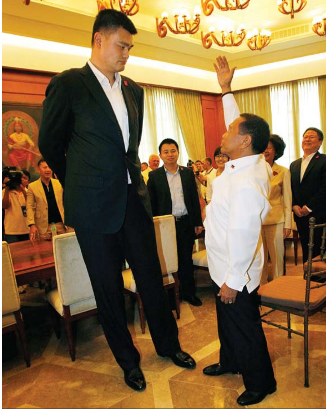
جيجيمار بيناي نائب الرئيس الفلبيني يتحدث إلى لاعب كرة السلة العملاق الصيني دونغ فانغ مينغ لاعب ومالك نادي شنغهاي شاركس خلال زيارته وفريقه لقصر جوز الهند في مانيل.

أكدت نتائج تجارب علمية أجريت مؤخرا على مجموعة من خلايا الدماغ التي تملك القدرة على التحكم في شهية الأكل، التي يمكن أن تكون السبب الرئيس لاضطرابات الأكل مثل البديانة. وقال الباحثون في جامعة إست أنغليا البريطانية الذين نشروا بحثهم في المجلة المتخصصة (علم الأعصاب): إن نتائج الأبحاث التي خلصوا إليها تقيد بأن شهية الأكل لا تتشكل عند الولادة. وعكف الباحثون على دراسة جزء من الدماغ يسمى الوطاء، وهو مسؤول عن تنظيم عملية النوم وكيفية تصريف الطاقة وشهية الأكل والعطش ووظائف بيولوجية أخرى. ودرس الباحثون الخلايا العصبية المسؤولة عن تنظيم شهية الأكل باستخدام تقنية خريطة المصير الجيني، وخلصوا إلى أن بعض الخلايا تضفي الأعصاب إلى الدوائر المسؤولة عن تنظيم شهية الأكل في دماغ الفأرة بعد الولادة وخلال عملية النمو.